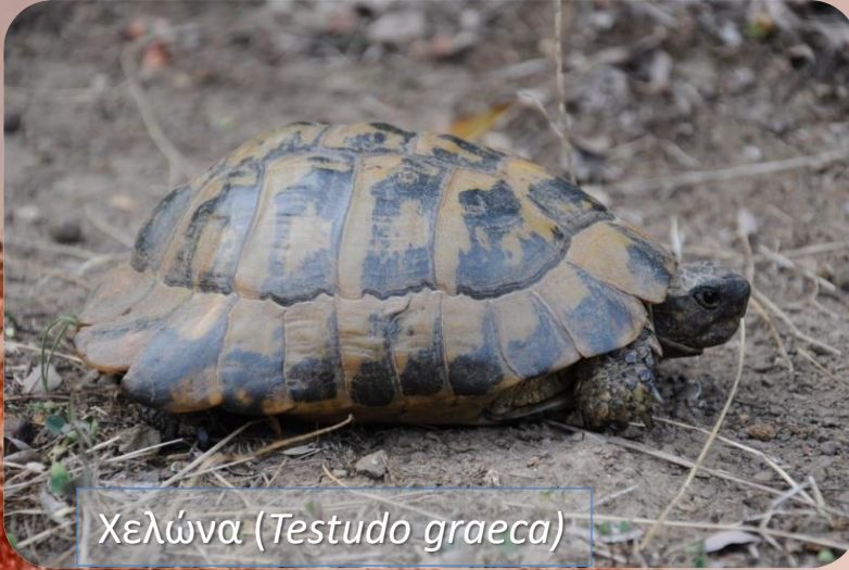
Χελώνα ( Testudo graeca )