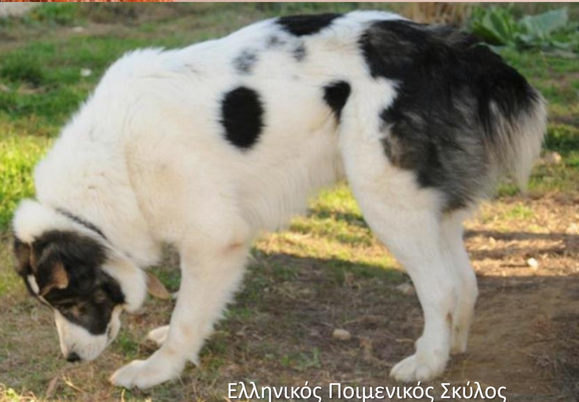
Ελληνικός Ποιμενικός Σκύλος

• Προσαρμόζεται εύκολα στην καθημερινή διαβίωση του κοπαδιού, κινείται ελεύθερα χωρίς να ενοχλεί τα ζώα, ενώ σύντομα αναπτύσσει μαζί τους σχέσεις συμβίωσης και ένστικτο προστασίας.