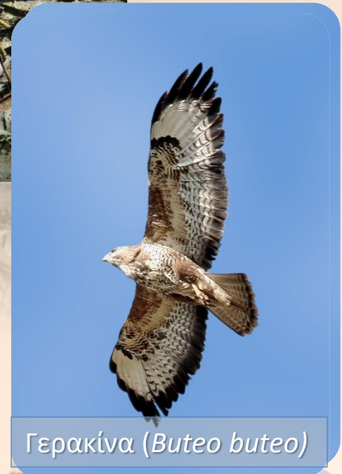
Γερακίνα ( Buteo buteo )