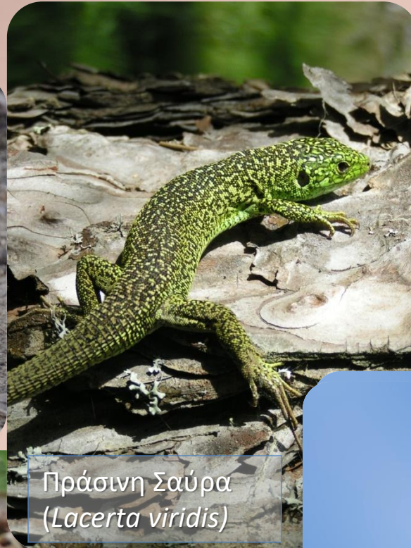
Πράσινη Σαύρα ( Lacerta viridis )