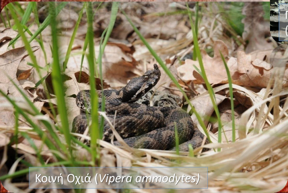
Κοινή Οχιά ( Vipera ammodytes )